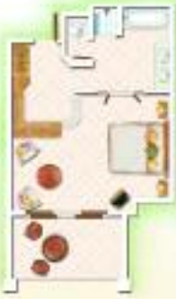
Chambre Supérieure Superior Room