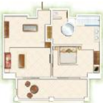
Suite Senior Senior Suite