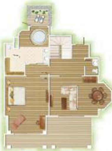
Suite Famille rez-de-chaussée Family Suite ground floor