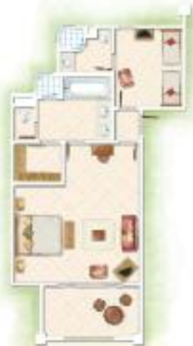
Appartement Famille Family Apartment