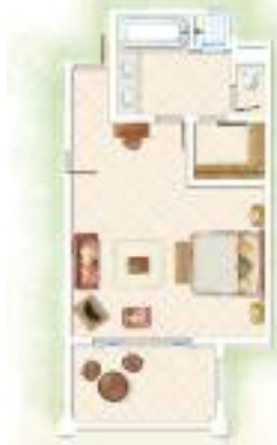
Chambre Deluxe Deluxe Room